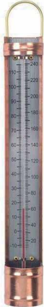
25.0636 350x220 mm. Psicómetro