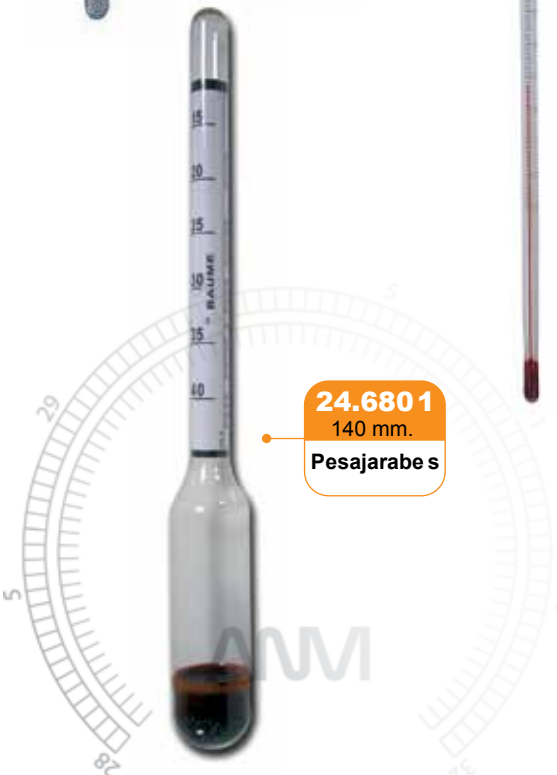
24.6801 140 mm. Pesajarabe s